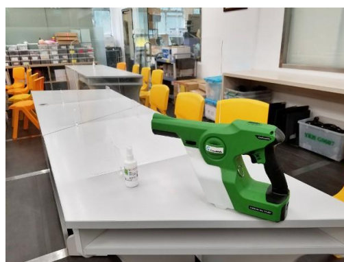
校方獲科大提供消毒劑及用具，加強防疫效能。