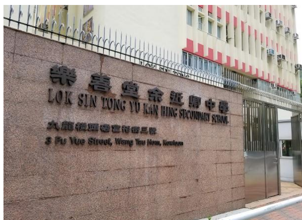
樂善堂余近卿中學正為復課做準備。