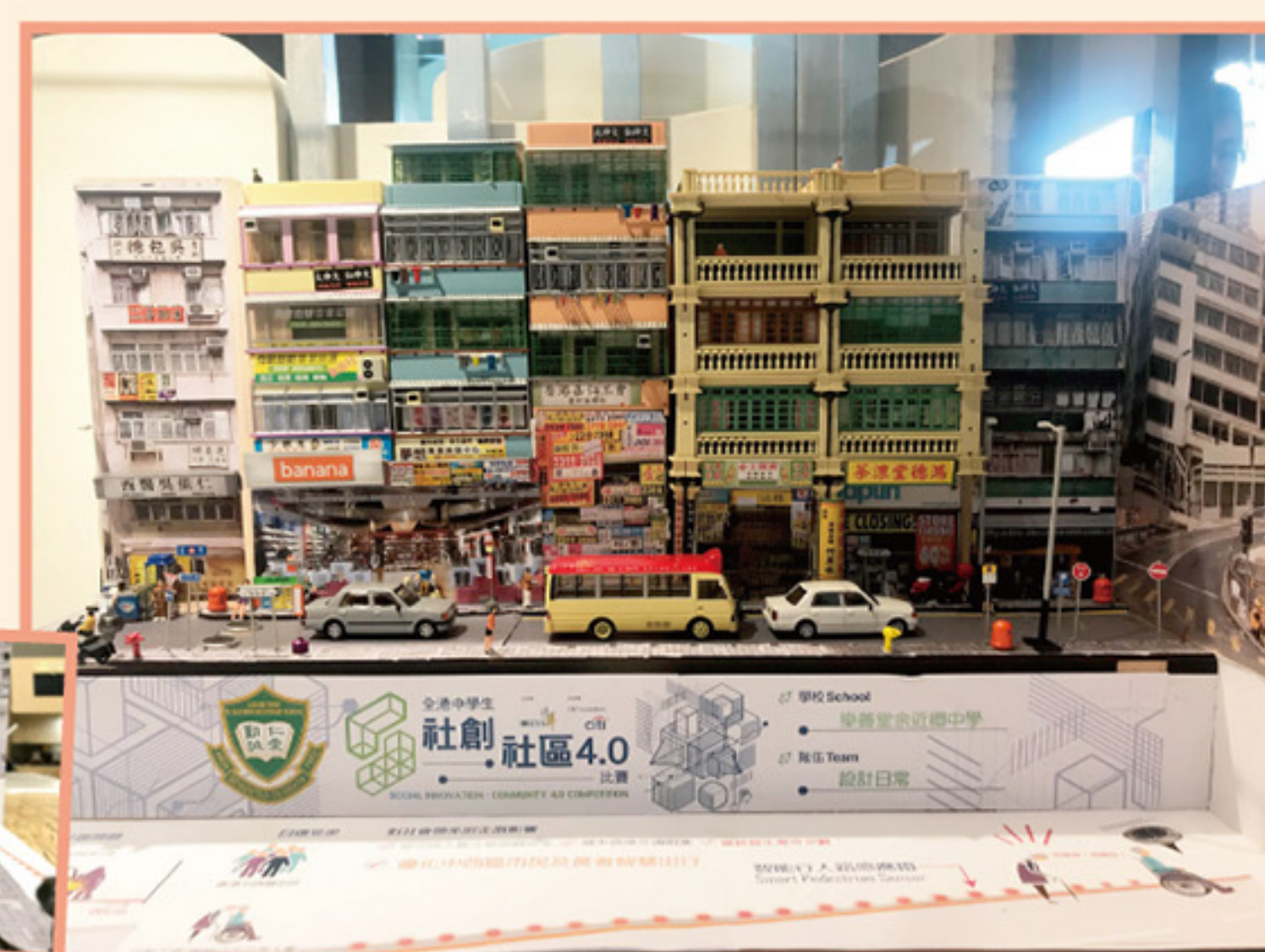
同學研製的「智能行人路感應燈」為市民帶來方便，在比賽中獲得亞軍。原型實體製作精巧，讓創意意念躍出紙張，化為實物展示人前，奪得「最有外在美大獎」。