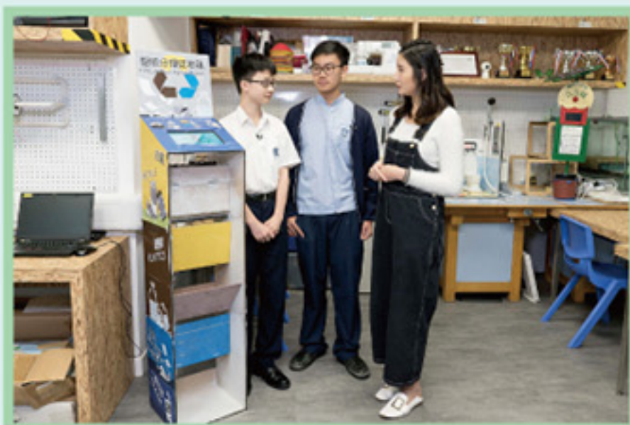
兩位同學獲電視台邀請接受訪問，介紹他們製作的「智能分類回收箱」。

「智能分類回收箱」以直立式設計，分為四個層格。當回收物品被投入回收箱後，最頂層的內置鏡頭便會啟動，對投入物品進行多角度拍攝，以獲取多角度圖像信息。識別系統服務器使用Google Vision API 將所獲取的信息進行人工智能圖像辨識，對物品進行性質判定，包括形狀、體積、質量等數據。當訊息辨別妥當，回收格的活門便隨之打開，將廢紙、塑膠、鋁罐分層收集，而最底層則收集一般垃圾。鑑別物品類別的整個過程只需數秒，而且辨識次數愈多，準確度愈高。